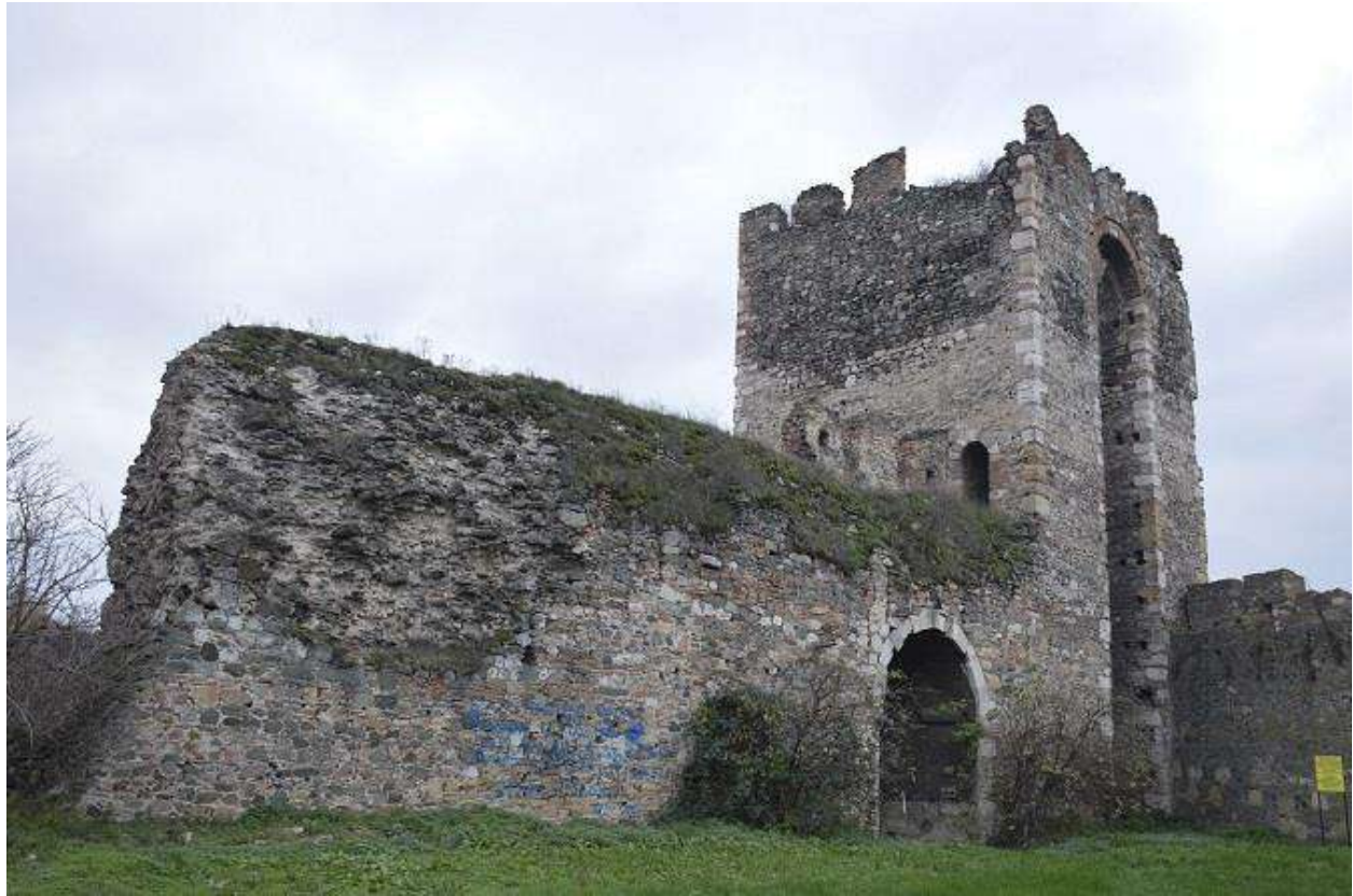
Смедеревска тврђава

Пошто је град предат без борбе, Турци су дозволили да деспот Стјепан и његова жена Марија понесу из града све што желе. Они узимају мошти св. Луке и носе за Босну (Маријина мајка Јелена Бранковић понела је Претечину десницу). Мошти су једно време биле смештене у тврђави Теочак код Зворника. Пред новом опасношћу од Турака, Стјепан преноси мошти у своју престоницу Јајце.