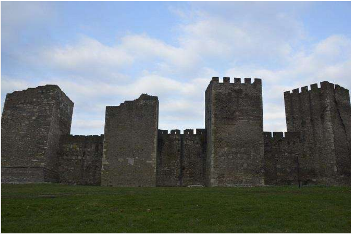
Смедеревска тврђава

Где се налази град Рогос (или утврђење), из кога се су мошти Светог Луке пренете у Смедерево? Чувени отомански путописац Евлија Челебија (1611-1682) пише да се насеље тог имена налази између Луроса и Арте, данашњег седишта Епирске области, где су у његово време постојале рушевине моћног замка који се зове Рогос или Рогај на арбанашком језику. Тако сазнајемо да је Арта, у доба деспота Ђурђа, била седиште Епирске деспотовине, као и да се цела област звала Рогос.