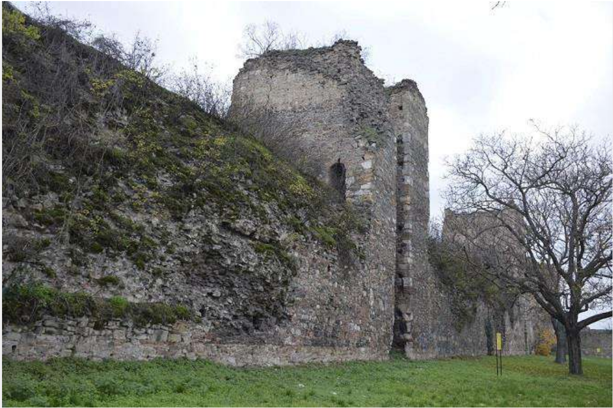
Смедеревска тврђава