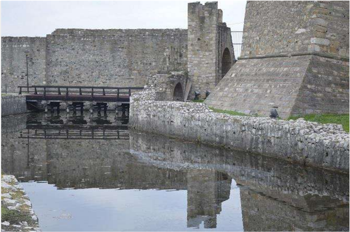
Смедеревска тврђава

Упоредо са изградњом Тврђаве, Ђурађ је изградио мању цркву у Малом граду (вероватно само за потребе властеле) и већу цркву „Благовештање“ (била је лево од главног улаза у Тврђаву) у којој су се од 1453. до 1459. налазиле мошти апостола Луке.