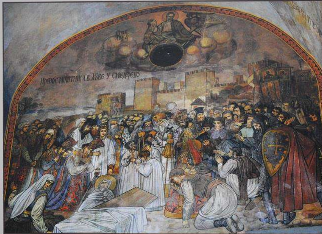
Пренос моштију Светог Луке

С циљем одбране Деспотовине и задобијања Божије благодети, почетком јесени 1448. зачала се идеја о куповини моштију апостола Луке