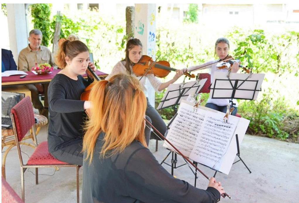
Гудачки квартет Школе за музичке таленте у Ћуприји је отворио скуп